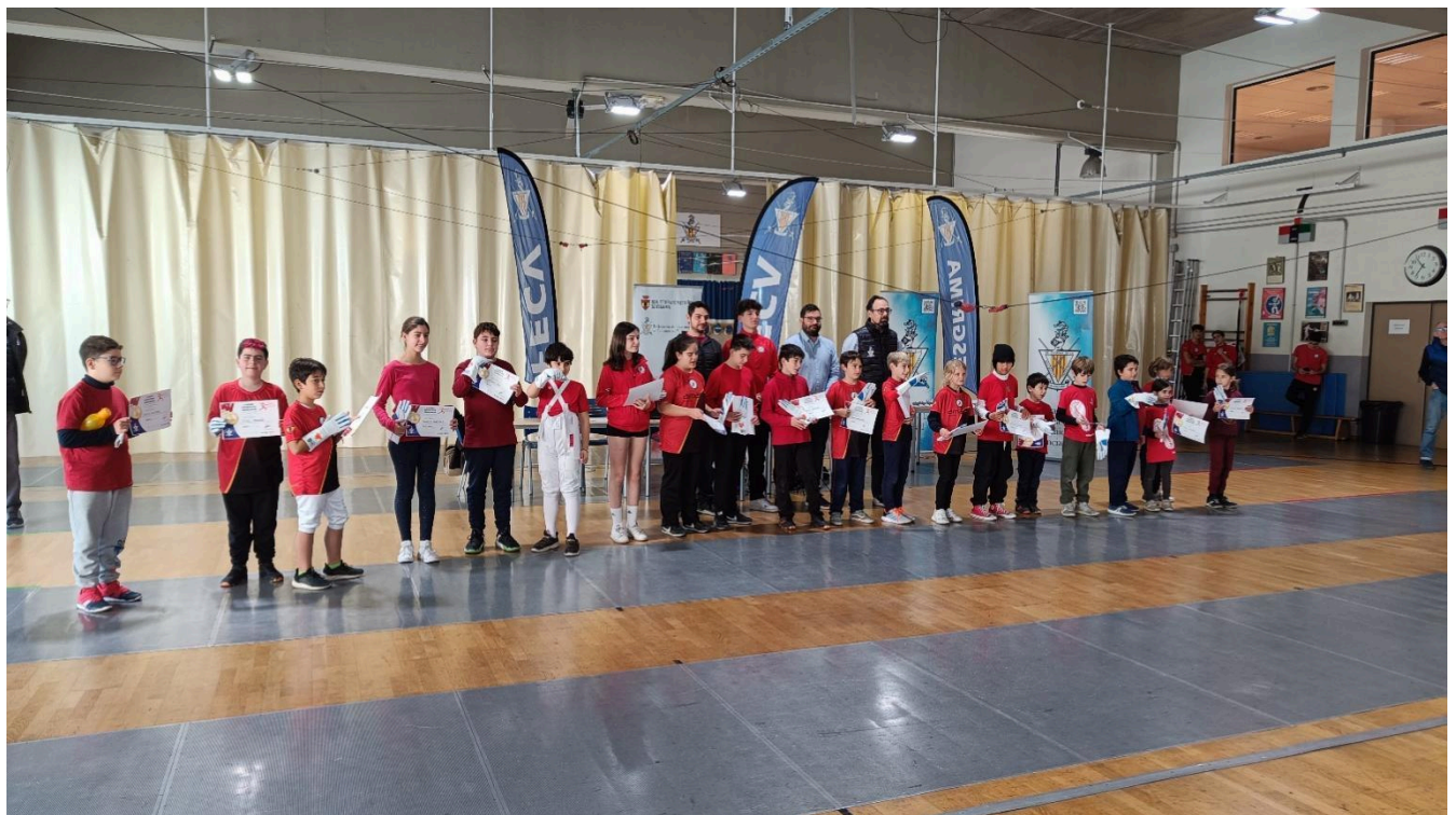
FECV C/Uruguay 11 despacho 602 46017 VALENCIA