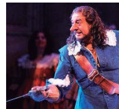
EN ESCENA. Plácido Domingo, caracterizado como Cyrano de Bergerac en 2006.

MAESTROS INVISIBLES. Además de ser un gurú de este deporte, del que existen en España 6.162 licencias federativas (frente al más de un millón que hay, por ejemplo, de fútbol), Juan es licenciado en criminología y se dedica al análisis de conducta de asesinos en serie. Por su parte, Vicente es licenciado en arte dramático y dirección de Escena, formación que encaja con su labor en esgrima artística. Han trabajado con Plácido Domingo para su papel de Bergerac o con Pavarotti en Fausto , además de en teatros de la Ópera de España, Francia, Italia... Entienden la esgrima como deporte noble y una de las virtudes del caballero es la discreción. “Siempre hemos intentado que la relación con tenores, actores o actrices no trascienda lo profesional”, explica Juan.